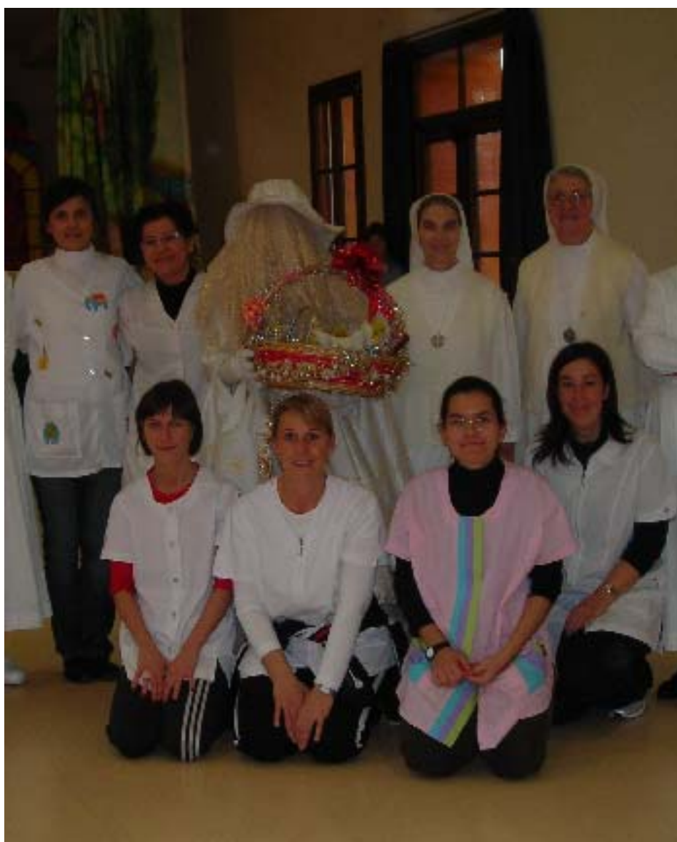
La Coordinatrice didattica , la Madre Superiore e le Insegnanti il giorno di S. Lucia.

Tale progetto educativo deve essere conosciuto e accettato dai genitori, condiviso e verificato da tutte le componenti della comunità scolastica: gestori, educatori e personale ausiliario.